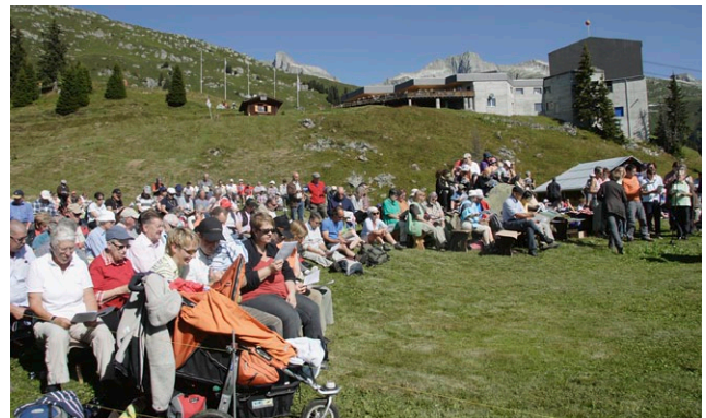
Ökumenischer Gottesdienst, 30. August 2009